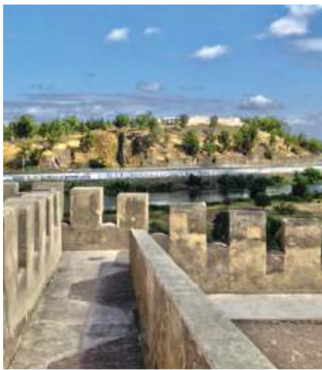
Vista del Fuerte de San Cristóbal desde la Alcazaba

Dentro del Fuerte de San Cristóbal, encontrará paneles informativos, en los que se puede descargar más información a su teléfono mediante códigos QR .