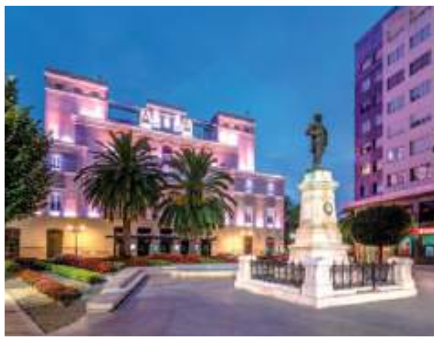
Plaza de Minayo

Antes de começar o percurso pelas Praças e Edifícios Singulares, recomendamos-lhe que visite qualquer dos Postos de Turismo de Badajoz para se informar sobre estes aspetos.